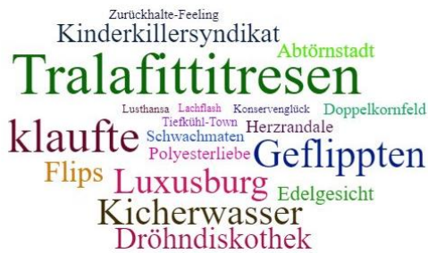
Bild 1. Neologismen im Udo-Lindenberg-Archiv.